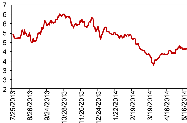
PRKME Kapanış (TL)