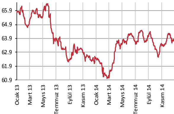
Yabancı Takası (%)

Veriler 10 gün gecikmelidir