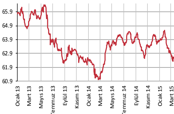
Yabancı Takası (%)

Veriler 10 gün gecikmelidir