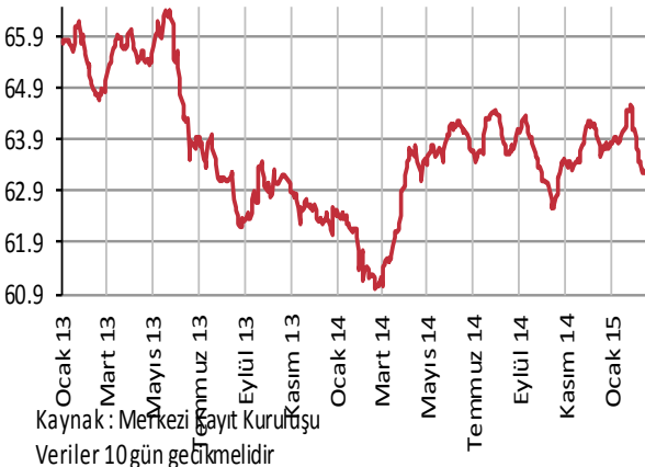
Yabancı Takası (%)

Cumhurbaşkanı Erdoğan Merkez Bankası Başkanı Erdem Başçı'nın kendisiyle görüşme talebi olduğunu belirtti ve "Çağırıp konuşacağız" dedi.