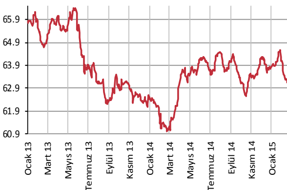
Yabancı Takası (%)

Kaynak : Merkezi Kayıt Kuruluşu Veriler 10 gün gecikmelidir