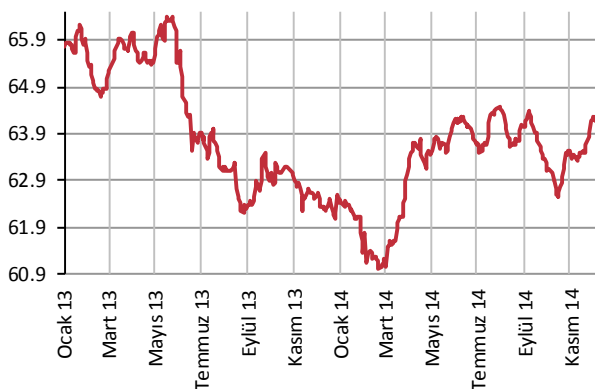
Yabancı Takası (%)

Veriler 10 gün gecikmelidir