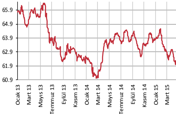
Yabancı Takası (%)