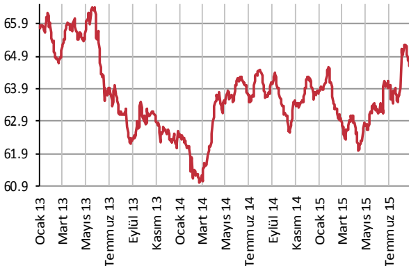
Yabancı Takası (%)