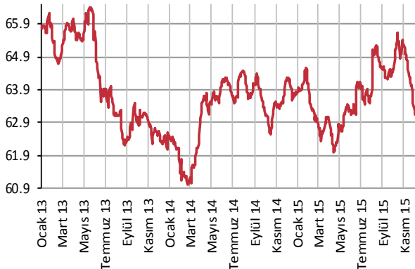
Yabancı Takası (%)